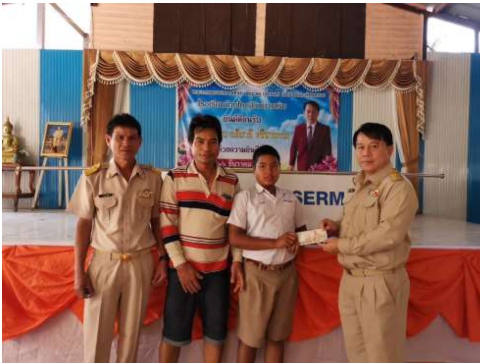
มอบทุนการศึกษา