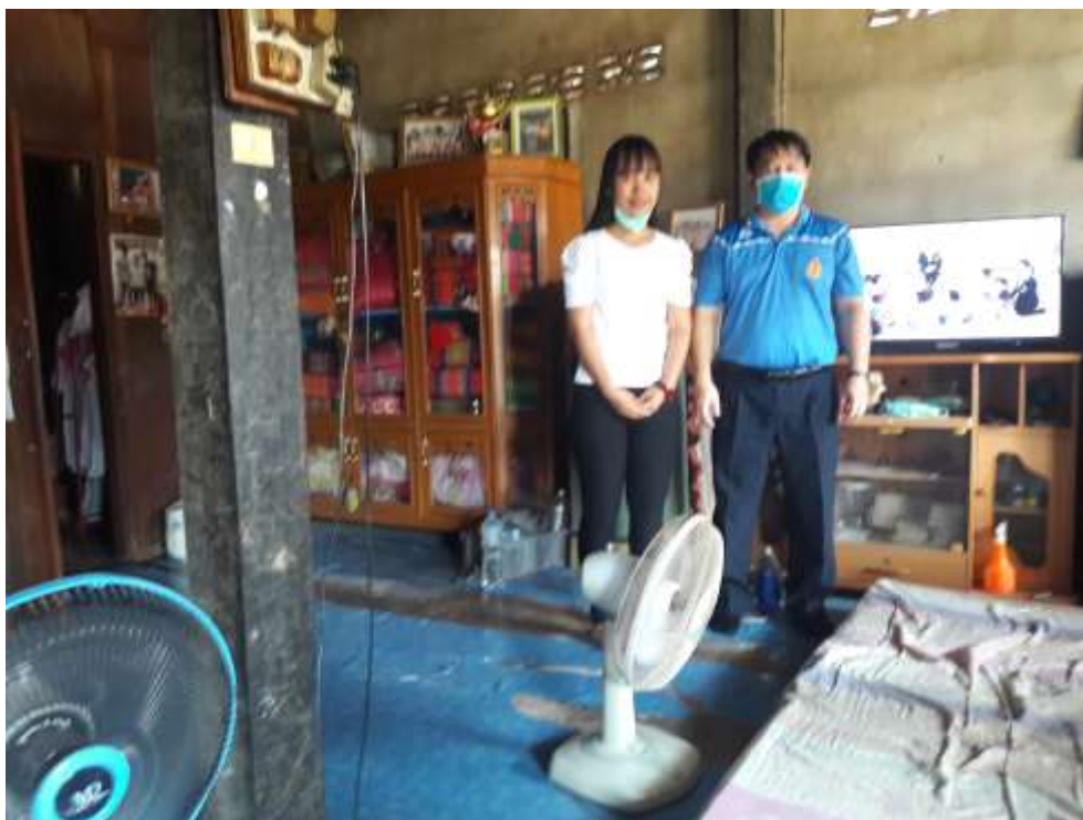
เยี่ยมบ้านนักเรียน