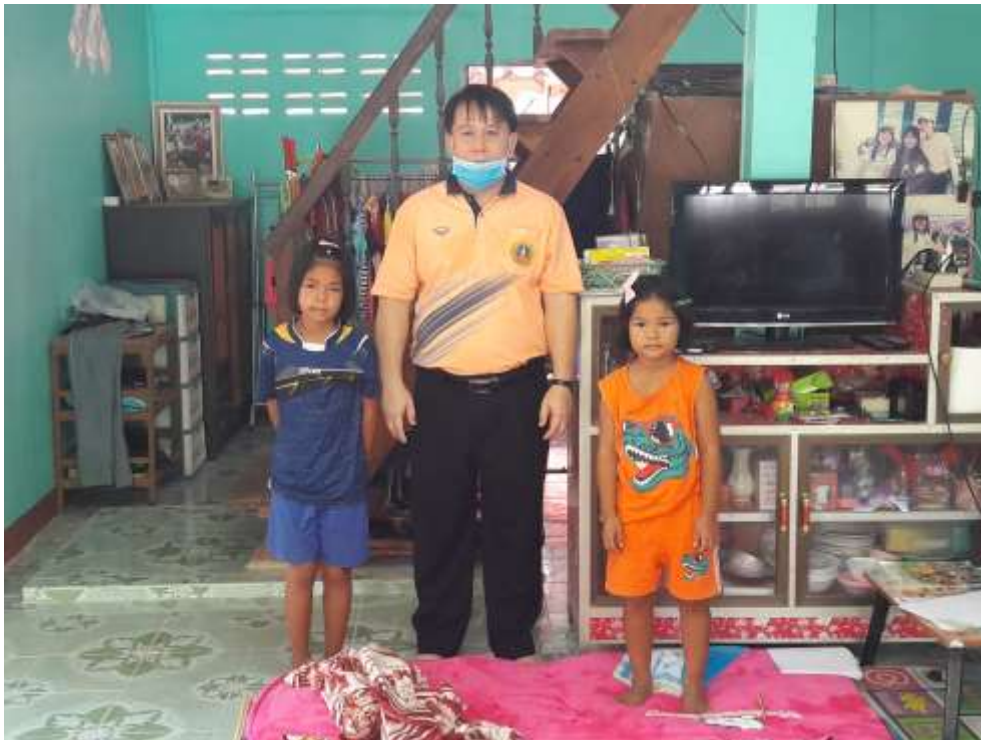
เยี่ยมบ้านนักเรียน