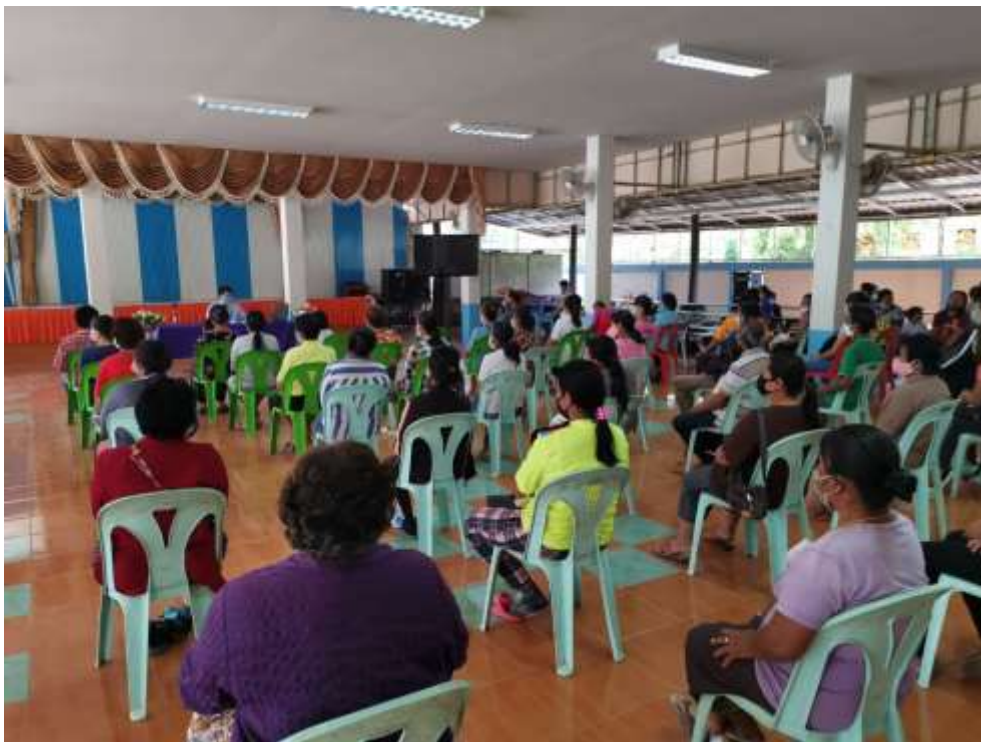
ประชุมผู้ปกครองนักเรียน