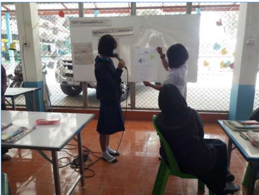
รูปภาพ การจัดการเรียนการสอน