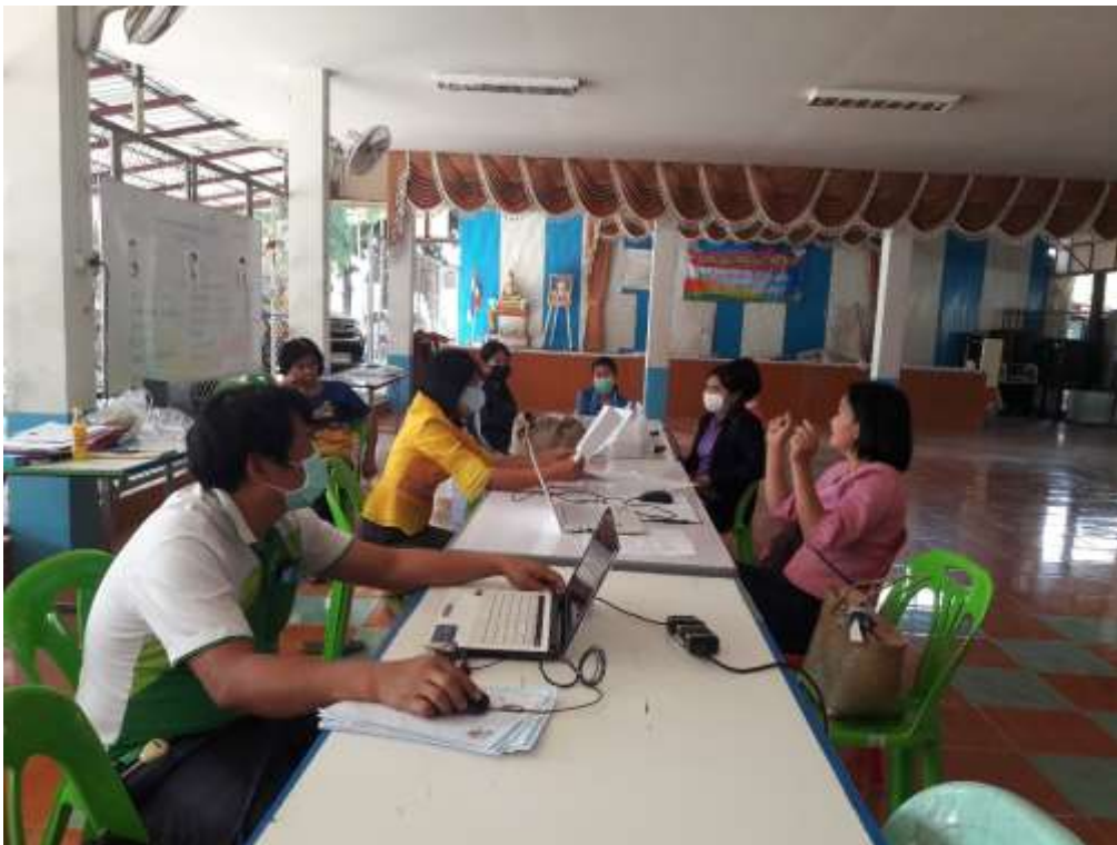
รูปภาพ การประชุมสะท้อนผลการจัดการเรียนการสอน