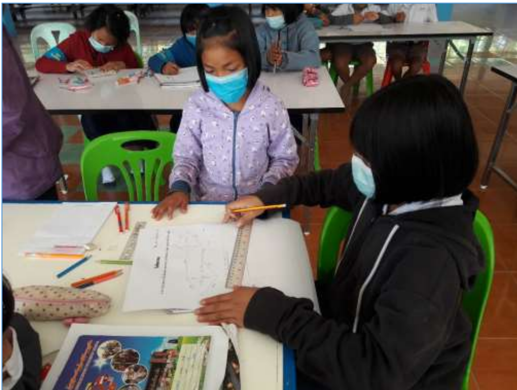
รูปภาพ การจัดการเรียนการสอน