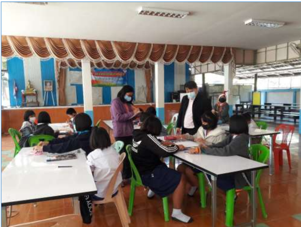
รูปภาพ การสังเกตการจัดการเรียนการสอน