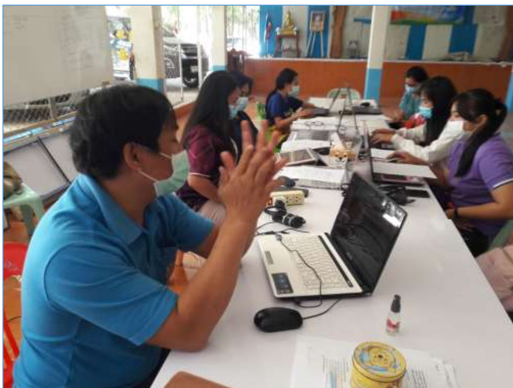
รูปภาพการประชุมร่วมกับเขียนแผนการสอน