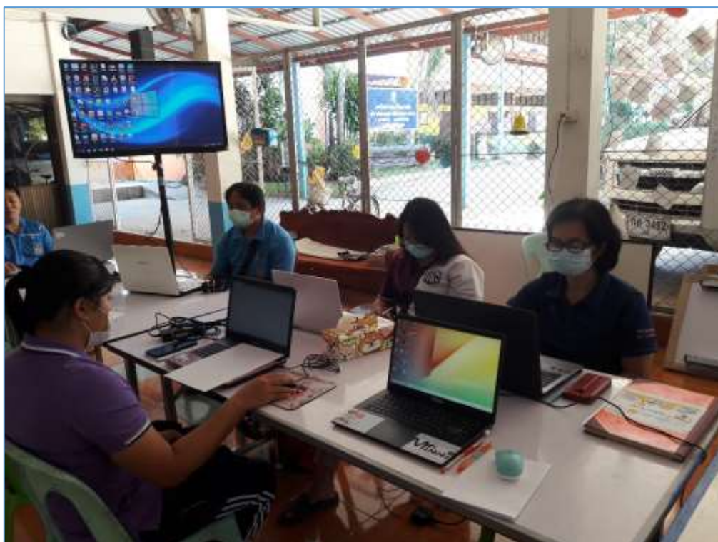
รูปภาพการประชุมร่วมกับเขียนแผนการสอน